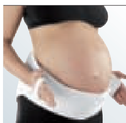
sistema de faixas