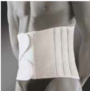
COR: Cinzento COLOR: Gris Mélange