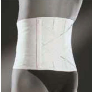
COR: Cinzento COLOR: Gris Mélange