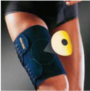
COR: Azul COLOR: Azul