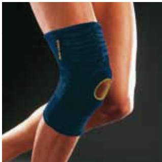
COR: Azul COLOR: Azul