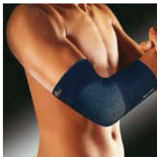
COR: Azul COLOR: Azul