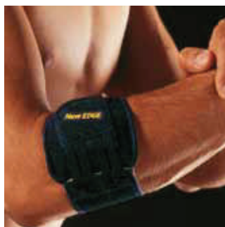
COR: Azul COLOR: Azul