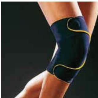
COR: Azul COLOR: Azul