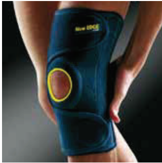
COR: Azul COLOR: Azul