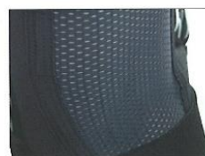
atrás (material de rede)