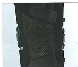
parte de trás (material de rede)