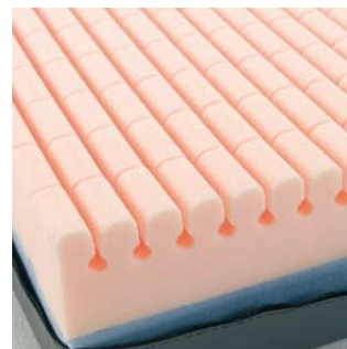
Construção durável O Softform Excel é o colchão de prevenção de escaras mais recomendado por profissionais de saúde, em toda a Europa, para utilizadores com risco moderado de aparecimento de úlceras.