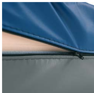
Abertura do fecho em 3 lados Facilita a inspeção da espuma.

A capa é impermeável aos líquidos, permeável aos vapores e é muito maleável por ser bi-elástica. Oferece muito conforto ao utilizador e protege-o contra o aparecimento de úlceras visto que as forças de deslizamento e fricção são minimizadas.